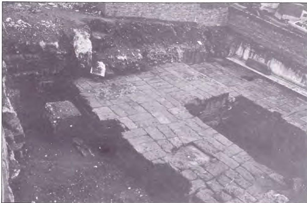
LÁMINA V. Aspecto de la cella desde el Norte y de la muralla situada detrás del posticum del templo.

dicha plataforma, se encuentra ya el firme natural, constituido por una marga arcillosa muy compacta de color verde-gris claro.